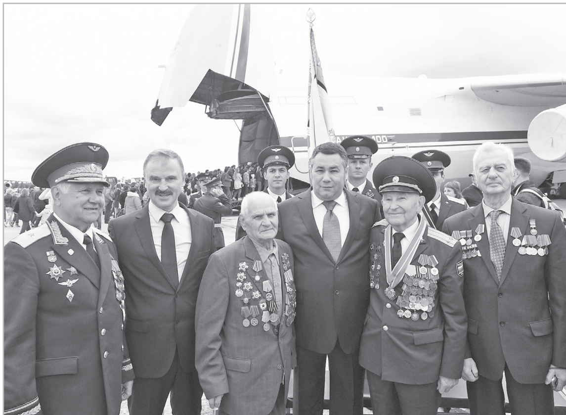
События, которые проходят в регионе, могут служить не только для повышения привлекательности территории, но и для воспитания молодежи на примере старших поколений

Впрочем, каждый мог выбрать то, что ему ближе по духу. Любители вкусно поесть предпочли гастрономический фестиваль «У Пожарского в Торжке». Приверженцы народных традиций и русской культуры отправились на знаменитые «Троицкие гулянья» в Василёво, где под открытым небом в обрамлении зелени раскинулся музей деревянного зодчества. Те, чье воображение будоражат волны и паруса, приехали на Ивановское водохранилище, где в яхт-клубе Конаково Ривер Клуб прошел парусный фестиваль «Народная регата». Но больше всего зрителей, около 30 тысяч человек, привлекли «открытые двери» аэродрома Мигалово в Тве-