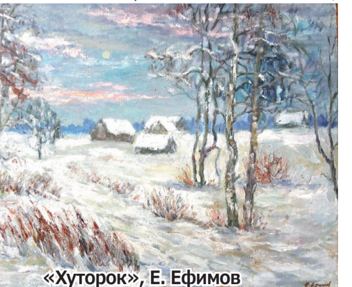
«Хуторок», Е. Ефимов

– Укажите в своей статье, что наша задача – не соревнование в живописи,