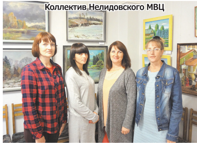
Коллектив Нелидовского МВЦ

условности тяготеет скорее к идеализации пейзажа, нежели к экспрессии, а композиция скромно складывается из прелестных, заснеженных ёлочек, которых ещё не коснулась «циркулярка» заготовителя. Объект изображения расположен довольно далеко от картинной плоскости, поэтому зритель ненавязчиво вовлекается во взаимодействие с изображённым на картине, будто ступая по чистому хрустящему снегу.