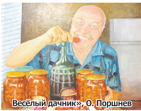
«Весёлый дачник», О. Поршневу