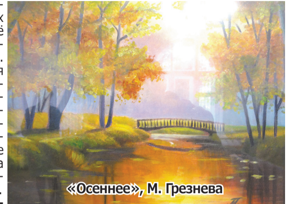
«Осеннее», М. Грезнева

тем более в листве желтовато-оранжевых клёнов. Подкупает название работы – звучное и лаконичное, не требующее разъяснения.