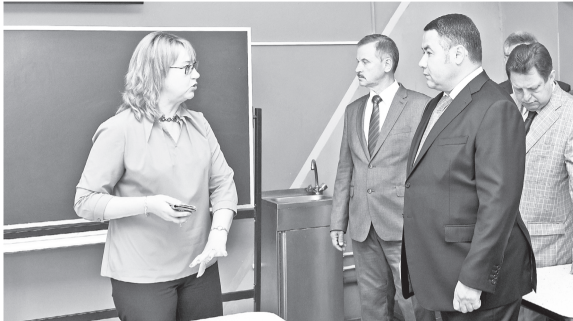
Губернатор Игорь Руденя лично проинспектировал в Твери готовность образовательных учреждений к началу учебного процесса и посоветовал руководителям районов сделать то же самое на своих территориях

Во-первых, необходимо обеспечить детям комфортные бытовые условия – завершить текущие и капитальные ремонты, позаботиться о необходимом оснащении образовательных учреждений, благоустроить территории. Во-вторых, обеспечить их безопасность. В-третьих, укомплектовать педагогические коллективы квалифицированными кадрами. Вопрос обсуждался 16 августа на совещании, которое прошло в формате расширенной видеоконференции. На связи были не только главы территорий, но и руководители отделов образо-