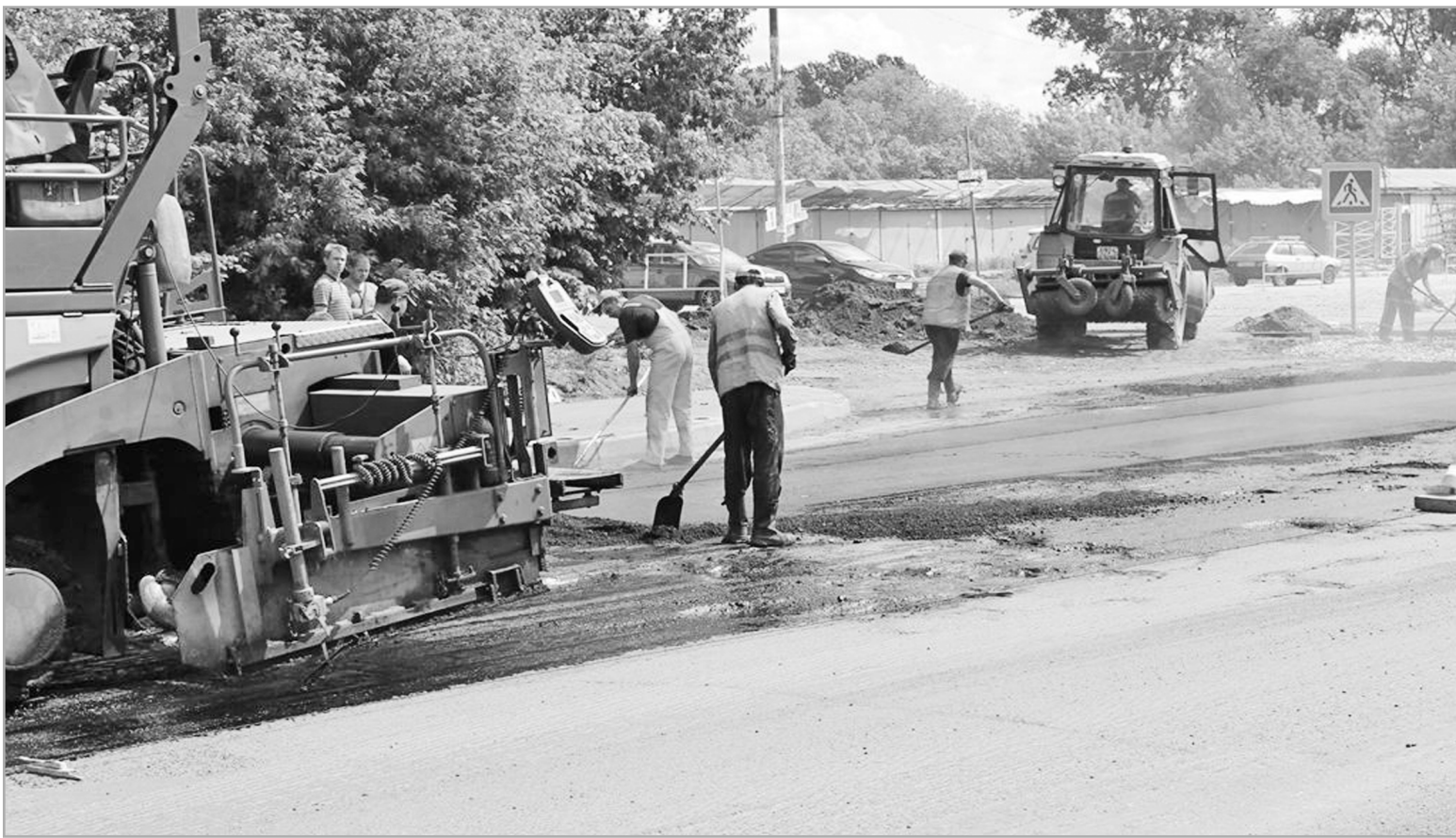
Бюджет регионального Дорожного фонда в текущем году увеличится на 30% по сравнению с 2018 годом и составит более 10 млрд рублей

– В прошлом году четвертая часть средств областного Дорожного фонда была