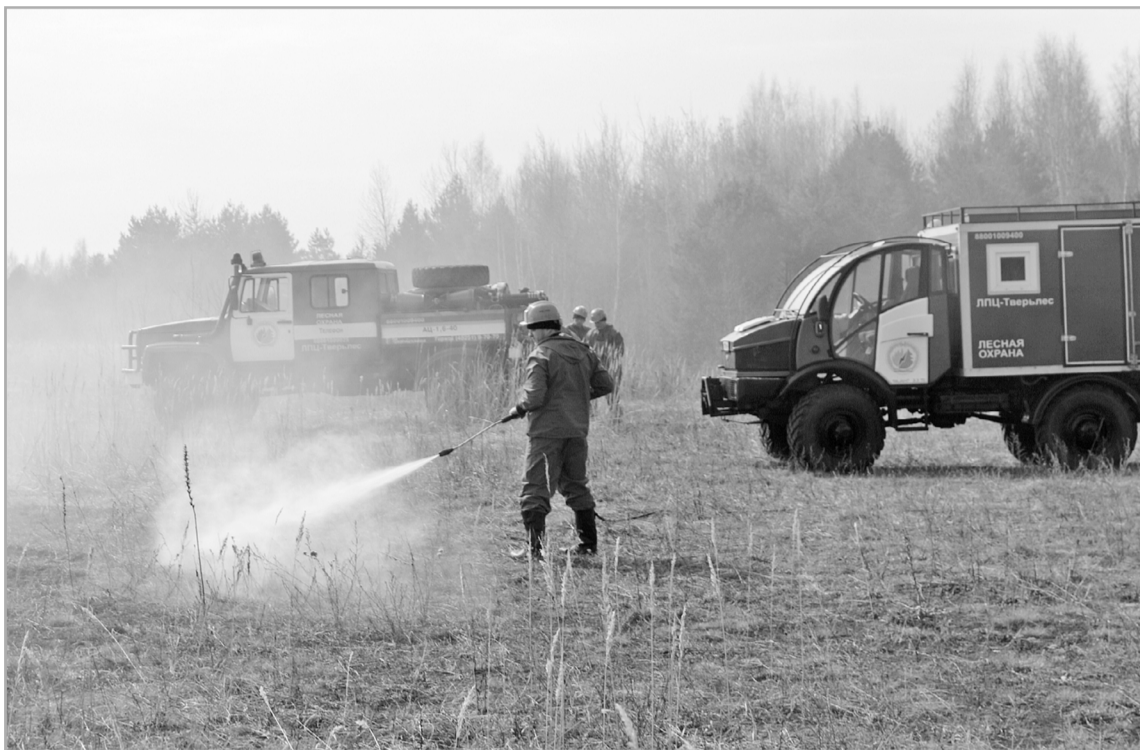
В регионе к борьбе с огнем готова хорошо оснащенная группировка противопожарных сил и средств

В прошлом году впервые за долгое время торфяных пожаров удалось избежать. А вот лес