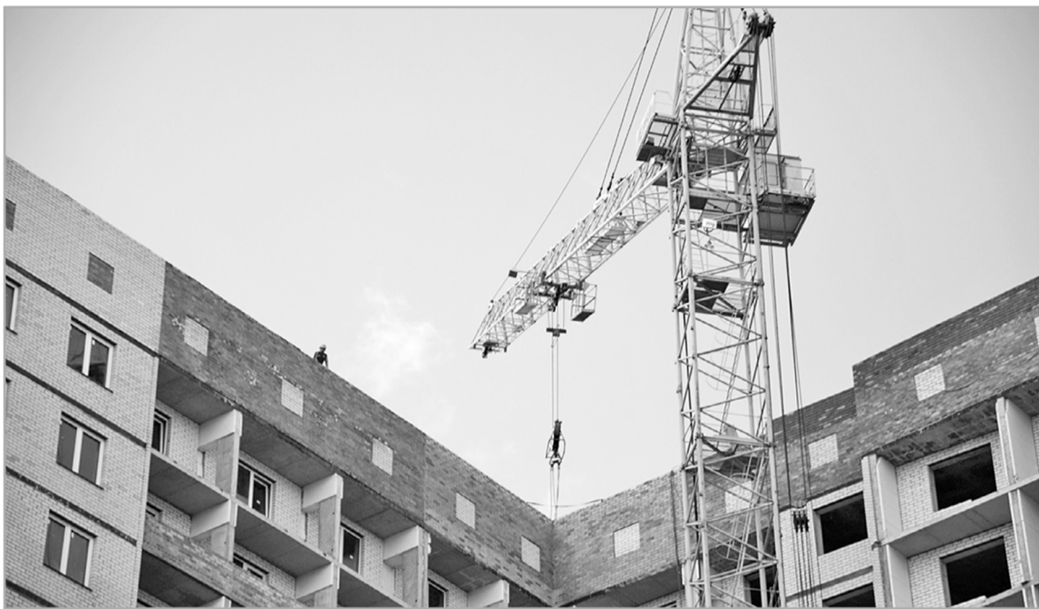
Подряд на строительство домов в рамках программы переселения из аварийного жилья смогут получить только компании, имеющие необходимые ресурсы

На протяжении шести предыдущих лет расселяли дома, признанные аварийными до 1 января 2012 года. С 2019 года начнут расселять жилфонд, включенный в единую федеральную базу данных аварийного жилья с 2012-го по 2016 год