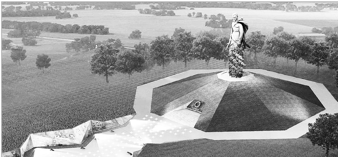
В Тверской области началось обустройство монолитных конструкций Ржевского мемориала Советскому солдату

В Тверской области на площадке Ржевского мемориала Советскому солдату ведутся бетонные работы под монолитные конструкции кургана, обустройство свай. Сформирован