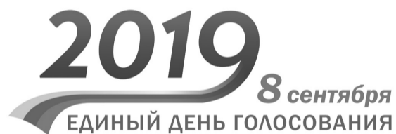
Сведения о муниципальных периодических печатных изданиях, которые обязаны предоставлять печатную площадь для проведения предвыборной агитации при проведении выборов депутатов Ржевской городской Думы седьмого созыва

Стадион «Торпедо» 10.00 – Турнир по мини-футболу среди детских команд. 13.00 – Чемпионат Тверской области по футболу. Площадка для пляжного волейбола (стадион «Горизонт») 12.00 – Турнир по пляжному волейболу.