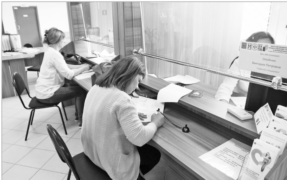
Возможность получить услуги по принципу «одного окна» есть во всех муниципальных районах и городских округах Тверской области

Собственно, показатели по охвату населения услугами, предоставляемыми с помощью МФЦ, достигнуты, и установки, обозначенные в майских указах Президента РФ, в нашем регионе выполнены. На территории Тверской области работает 33 филиала МФЦ и 91 территориально обособленное самостоятельное подразделение, их услуги доступны более чем 90% жителей всех муниципальных образований региона. За два года, если сравнивать 2018-й с 2016-м, количество