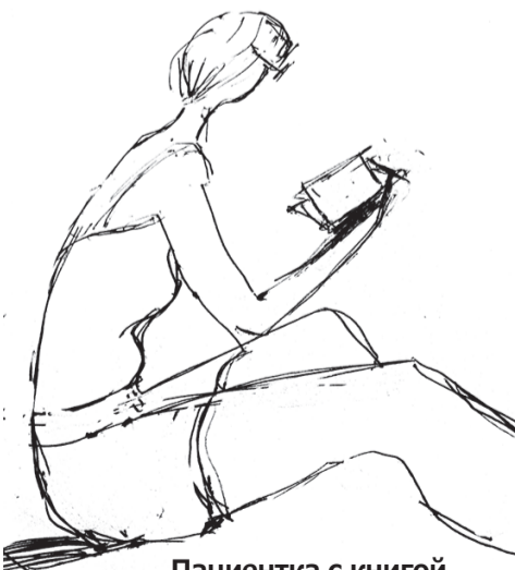
Пациентка с книгой

Мне вновь повезло, и я случайно узнал адрес Тверского офтальмологического центра «Взгляд», хотя в ржевской поликлинике мне дали направление на операцию в областную клиническую