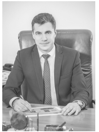
ГРАФИК ПРИЕМА ГРАЖДАН ДЕПУТАТАМИ РЖЕВСКОЙ ГОРОДСКОЙ ДУМЫ В НОЯБРЕ 2019 ГОДА

Награжден почетным знаком «20 лет ПФР» (2010 год), Благодарностью Председателя Правления ПФР (2012 год), почетным знаком «25 лет ПФР» (2015 год), нагрудным знаком «Отличник ПФР» (2015 год), Благодарностью Губернатора Тверской области (2011 год), Почетной грамотой Губернатора Тверской области (2016 год).