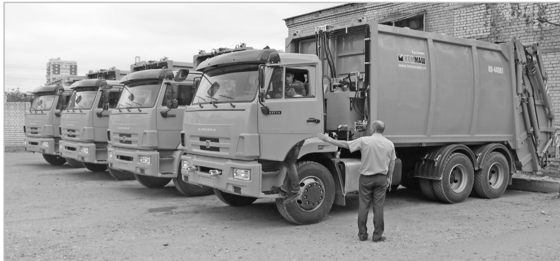
В основе новой системы обращения с ТКО – передовые технологии и строгие экологические стандарты безопасности

Мусорную реформу, к которой готовились весь прошлый год, в нашем регионе запустили в январе 2019-го. И все это время решали не только организационные вопросы – приобретение и установка новых контейнеров, закупка специальной техники, оптимизация взаимодействия регионально-го оператора ООО «ТСАХ» с