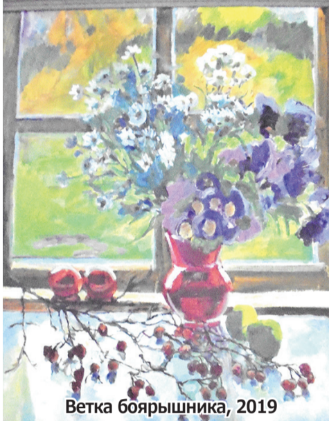
Ветка боярышника, 2019