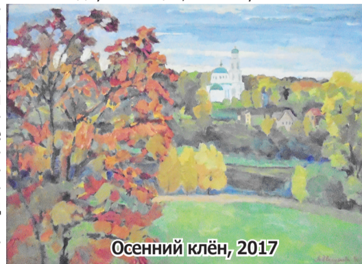
Осенний клён, 2017