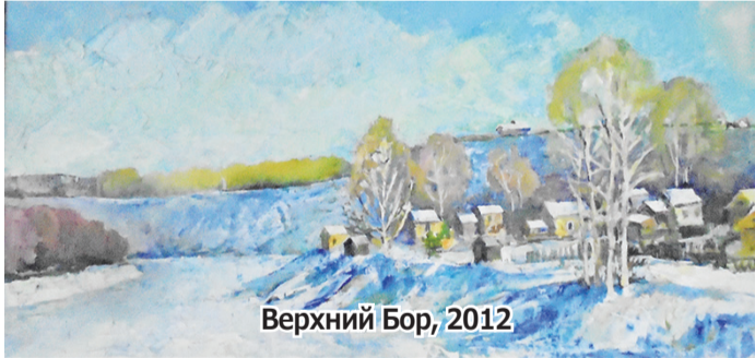
Верхний Бор, 2012

Правда, в отличие от И. Аввакумовой, у него деревья ещё меньше. Кажется, что в картине много пустот, промазанная зелёной и синей красками. В действительности это продуманные смысловые паузы, без которых не было бы ощущения огромного, я бы даже сказал,