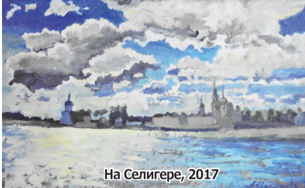
На Селигере, 2017

Полной противоположностью выступил водный массив Селигера в одноимённом названии картины. Состояние воды и неба представлено «На Селигере» как некое противоборство стихий, с тяготением к небесной сфере, которая, учитывая поч-