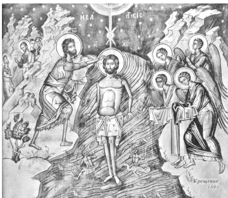
Крещение Господне. Фреска. Афон, монастырь Дионисиат. XVI в.