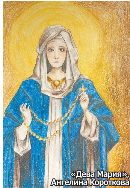
«Дева Мария», Ангелина Короткова