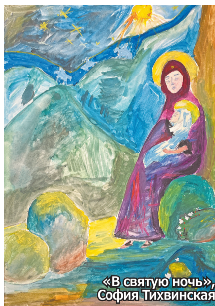
«В святую ночь», София Тихвинская