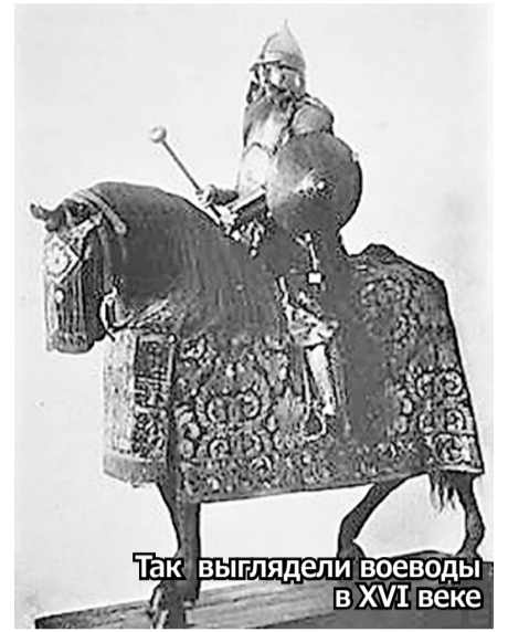
Так выглядели воеводы в XVI веке