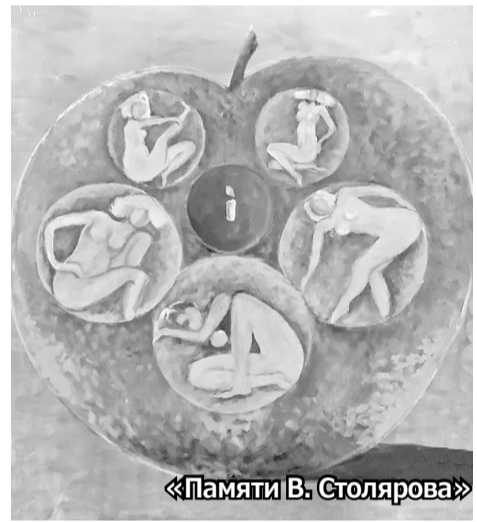
«Памяти В. Столярова»

Художник решает две задачи – образительную и выразительную, делая упор на идеализацию изображения. Угол зрения выбран несколько сверху – с учётом того, что зритель вовлекается в изображённый на картине сюжет. Картинное пространство построено свободно, фигуры совершенно одни, поэтому ничто не ме-