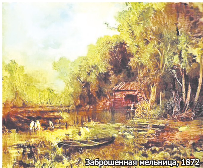
Заброшенная мельница, 1872