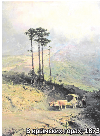
В крымских горах, 1873

«Мокрый луг» (1871) был написан уже в Крыму по ещё не остывшим воспоминаниям о Родине. Настроение в пейзаже создаётся чувством света, тонкой разработкой тональности, гармоничными переходами от светлых пятен к тёмным, мощным единством колорита. Васильев писал Крамскому: «Не думайте, что это настоящее болото, нет, настоящее-то впереди, а это только подготовительная работа». Тень от уходящих облаков скользит по ещё влажной траве, солнечный луч то вспыхивает, то угасает, а вода отражает бледное утреннее небо. Взгляд зрителя неторопливо и спокойно вовлекается в глубину композиции, вызывая улыбку и грусть одновременно – чувства, которые владели самим художником.