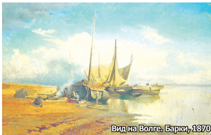
Вид на Волге. Барки, 1870