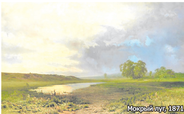
Мокрый луг, 1871

чался новый этап в творчестве молодого живописца. Они также ездили на Волгу, где делали наброски, зарисовки, писали этюды. Так появилось первое полотно внушительных размеров «Вид на Волге. Барки» (1870). Репин был старше Васильева на семь лет, тем не менее, сразу же попал под его влияние и даже написал об этом Крамскому: «Мы рабски подражали Фёдору Васильеву и верили его кисти, он стал для нас новым учителем».