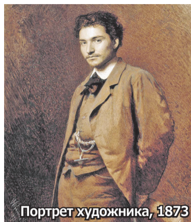
Портрет художника, 1873